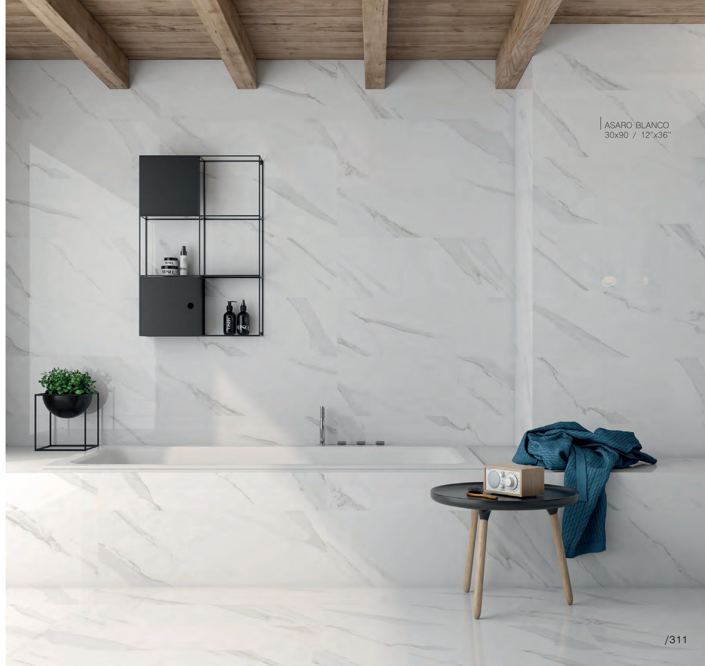
ASARO BLANCO 30x90 / 12"x36"