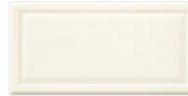
PALAZZO CREMA 30×60 PALAZZO CREMA 30×60