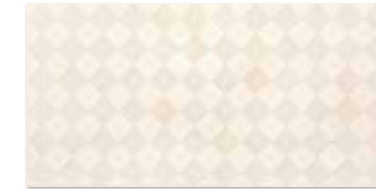
PALAZZO CREAM EINLEGER SHINE 30×60 PALAZZO CREAM INSERTO SHINE 30×60