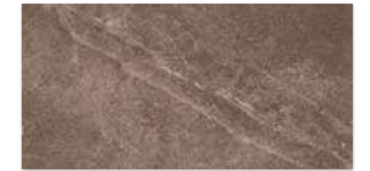
PALAZZO BROWN 30×60 PALAZZO BROWN 30×60