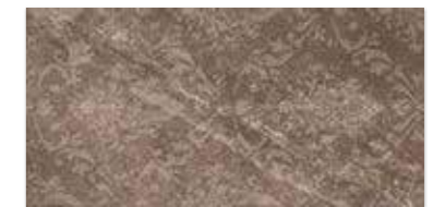
PALAZZO BROWN EINLEGER ORNAMENT 30×60 PALAZZO BROWN INSERTO ORNAMENT 30×60

VORGESCHLAGENE BODENFLIESE FÜR DIESE KOLLEKTION SUGGESTED FLOOR TILE FOR THIS COLLECTION