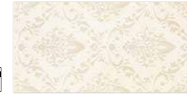
PALAZZO CREAM EINLEGER ORNAMENT 30×60 PALAZZO CREAM INSERTO ORNAMENT 30×60