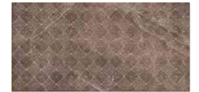
PALAZZO BROWN EINLEGER SHINE 3×60 PALAZZO BROWN INSERTO SHINE 30×60