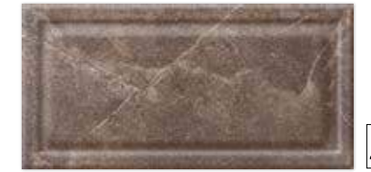
PALAZZO BROWN 30×60 PALAZZO BROWN 30×60