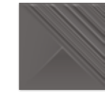
RAY GRAFIT 19,8×19,8 RAY GRAFIT 19,8×19,8