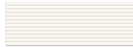
RAY BIANCO 25×75 RAY BIANCO 25×75

BIANCO • GRAFIT • SILVER 25×75 • 19,8×19,8