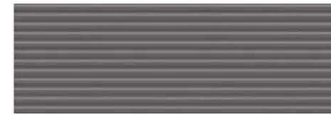
RAY GRAFIT 25×75 RAY GRAFIT 25×75