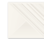
RAY BIANCO 19,8×19,8 RAY BIANCO 19,8×19,8